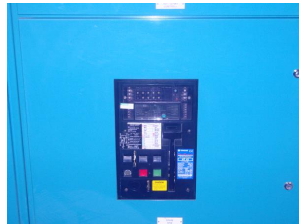
Bezawaryjne działanie przez piętnaście lat: Terasaki AT-series ACB

Zespół serwisowy Terasaki Direct Response zasąpił trzy wyłączniki „serii AT” na zmodernizowane TemPower 2 ACB. Zostały one zainstalowane bezpiecznie i szybko bez ingerencji w wymianie miedzianych przyłączy wewnątrz rozdzielni. Trzy wyłączniki „serii AT” zostały w pełni odnowione, przetestowane i oddane we ręce Credit Suisse jako części zapasowe.