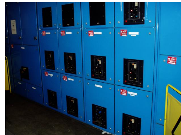
Przestarzały Merlin Gerin Selpact ACB